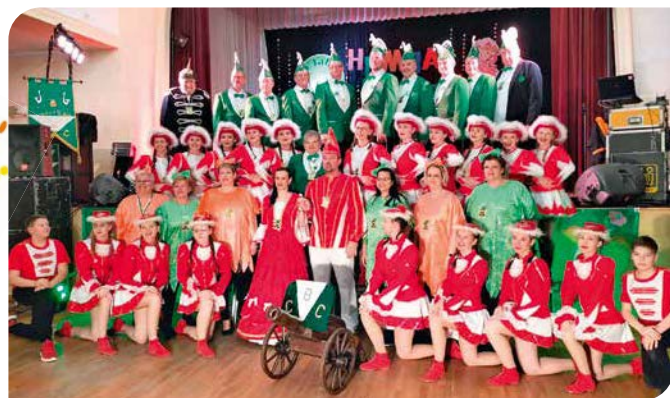
Der BCC in der vergangenen Saison

Die Aktiven des Karnevalsvereins haben sich für diesen Tag natürlich auch Einiges einfallen lassen! So sind alle Neugierigen, Schaulustigen, kleinen und großen Faschingsfreunde aus nah und fern herzlich eingeladen, bei der Schlüsselübergabe im Dorfzentrum (Straße der Einheit; am „Haus der Gesundheit“/„Physiotherapie Vital“) ab spääääätestens 11.00 Uhr dabei zu sein. Ein kleines karnevalistisches Programm und fröhliche Musik sind garantiert! Für das leibliche