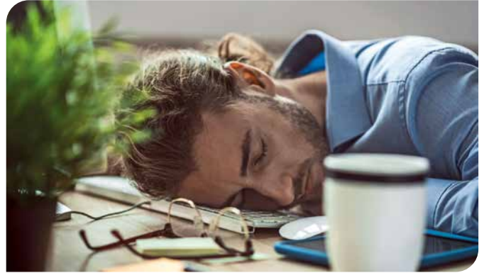
Leistungsfähigkeit und Lebensqualität werden bei chronischer Müdigkeit enorm eingeschränkt.

Müde und erschöpft ist jeder ab und zu – etwa in Phasen hoher körperlicher oder geistiger Anforderungen. Vor allem jedoch nach einer Krankheit fällt es Menschen oft schwer, wieder richtig auf die Füße zu kommen. Das zeigt sich derzeit ganz besonders am Beispiel von Covid-19. Auch wenn die Infektion überstanden ist, haben viele Mühe, sich vollständig zu erholen. Sie leiden unter anhaltender Abgeschlagenheit, Kraftlosigkeit und sind insgesamt weniger belastbar. Das kann die Lebensqualität stark beeinträchtigen. Grund genug für alle Betroffenen, die Regeneration aktiv zu fördern.