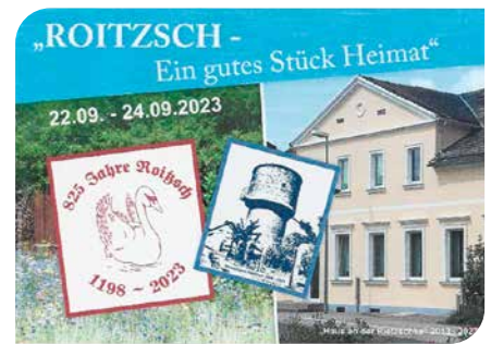
Aufkleber zum Herbstfest 2023 in Roitzsch

Am Nachmittag, noch vor 15.00 Uhr trafen die ersten L.U.I.S.E.N-KuchenliebhaberInnen auf dem Festgelände ein. Doch die Hauptattraktionen gab es für die Kinder mit Spiel, Spaß, Hüpfburg, Handwerkern und Kremserfahrten durchs Dorf für alle. Dass die gute Laune anhielt und die Gäste immer informiert waren dafür sorgte DJ Mike. Natürlich war an allen drei Tagen für das leibliche Wohl gesorgt.