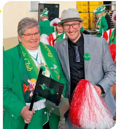
Das war die Schlüsselübergabe am 11.11.2022

Wohl ist natürlich auch bestens gesorgt – keiner wird hungrig oder durstig bleiben!