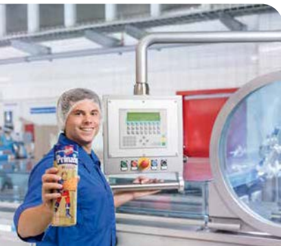
Bewerbertag – Leckere Jobs und die Produktion ... > Seite 9