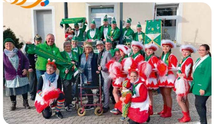
Schlüsselübergabe im vergangenen Jahr