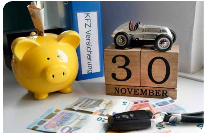
Bis zum 30. November können Autofahrer die Kfz-Versicherung wechseln. Ob sich ein Wechsel lohnt, hängt vom künftigen Preis und den Leistungen der Police ab.

Der günstige Preis allein sollte, wie die HUK-COBURG mitteilt, kein Entscheidungskriterium sein. Nur ein kritischer Blick auf die Leistungen schützt vor bösen Überraschungen im Schadenfall. Viel Wert legen Verbraucherschützer auf die Deckungssumme in der Kfz-Haftpflichtversicherung. Statt der gesetzlich vorgeschriebenen 7,5 Millionen Euro für Personenschäden sollte in der eigenen Police eine 100-Millionen-Euro-Deckung für Personen-, Sach- und Vermögensschäden (bei Personenschäden max. 15 Mio. Euro je geschädigte Person) je Schadenfall stehen. Nachdem Urlaub doch wieder ein