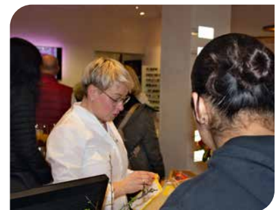
Impressionen vom letzten Nachtshopping am 31. März 2023